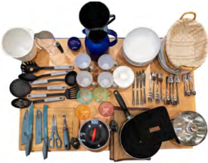
BEISPIEL - Inhalt kann variieren

- Folgende "Pakete" können zugebucht werden -